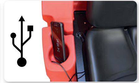
Porta USB USB port Puerto USB